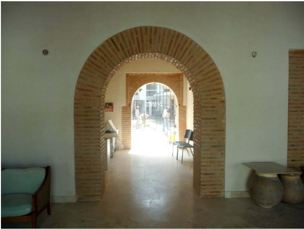
Entrée de la résidence