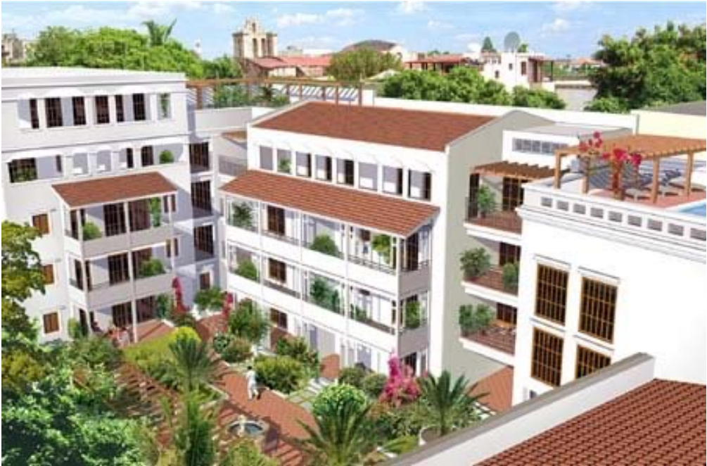
Appt 1, RCH (rez-de-chaussée), 91 m 2 , prix: 240 600 u$