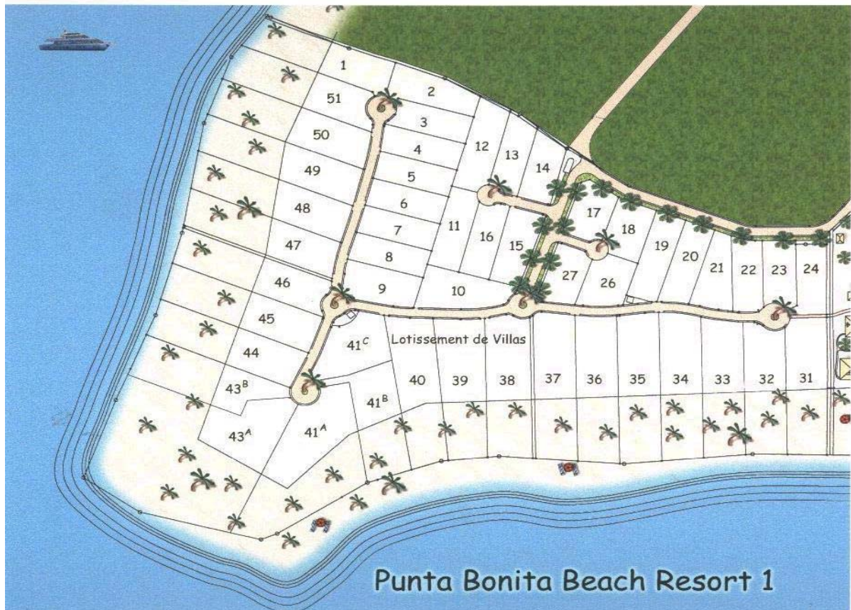
Découpage des lots