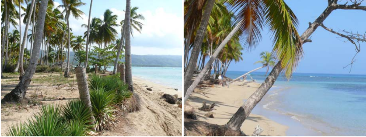
Photos de Playa Bonita