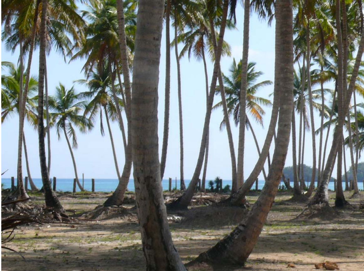
Vue des lots en vente

4 Lots disponibles en front de mer dans une très belle résidence.